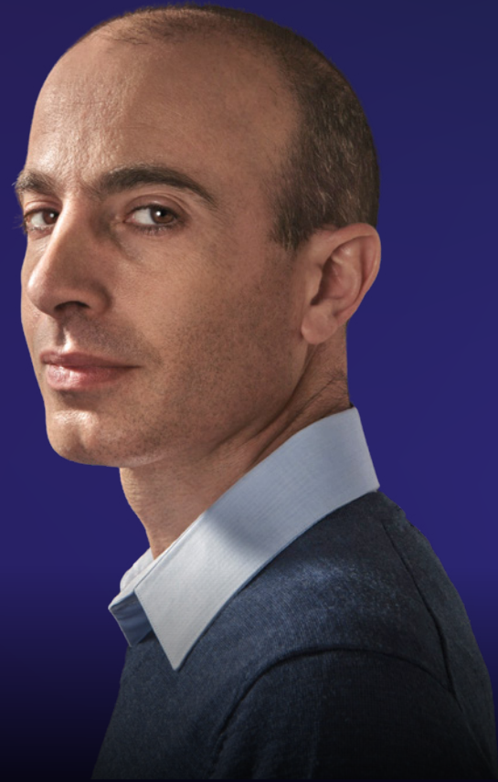
Yuval Noah Harari

Historiador y Best-seller "Sapiens: de animales a dioses".