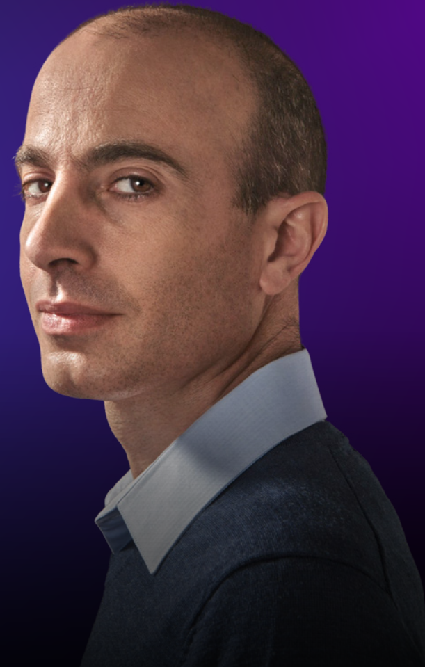
Yuval Noah Harari

Historiador y Best-seller "Sapiens: de animales a dioses".