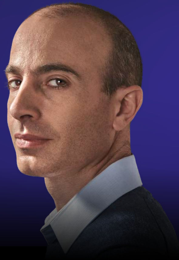
Yuval Noah Harari

Historiador y Best-seller "Sapiens: de animales a dioses".